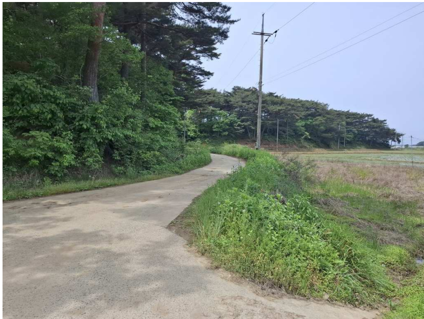
인접 도로 및 주위환경