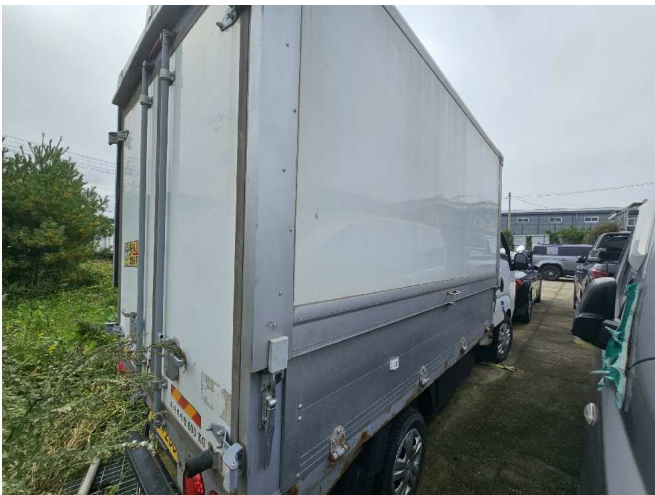
본건 차량 측면