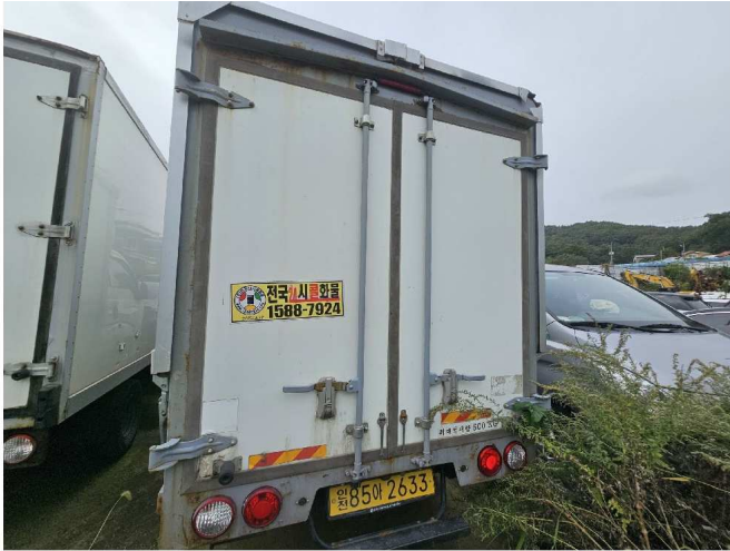
본건 차량 후면