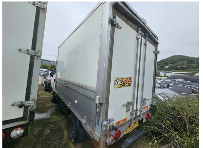
본건 차량 측면