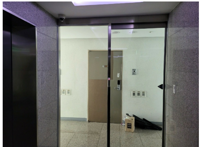
2 201 ~210