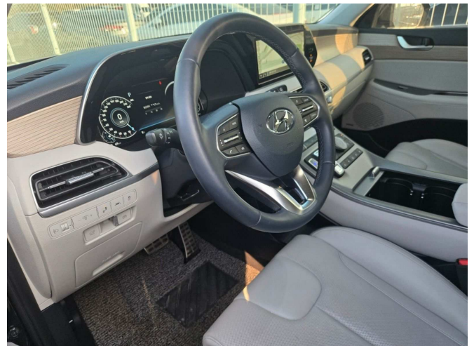
본건 내부 운전석