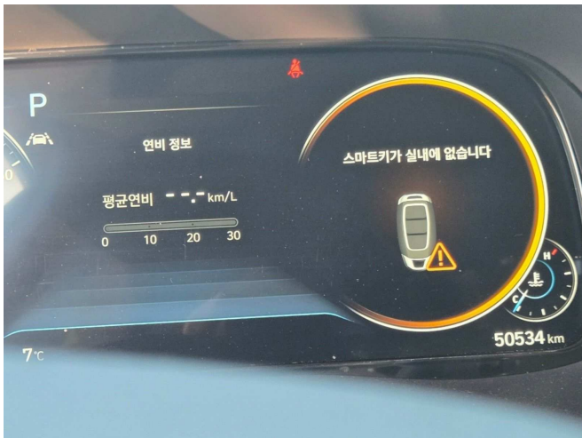
본건 내부 계기판