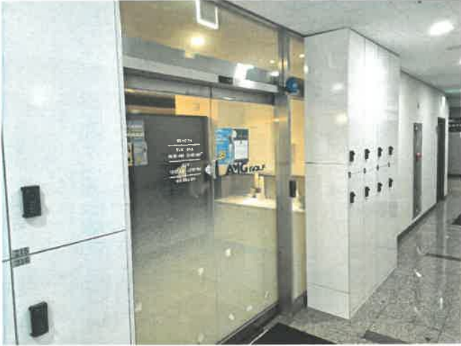
[본건 입구 전경(기호(사)~(차))]