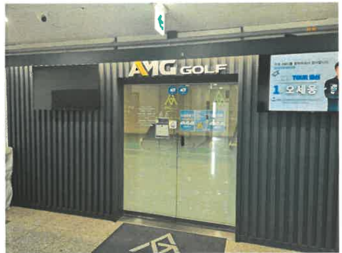
[본건 입구 전경(기호(가)~(바))]