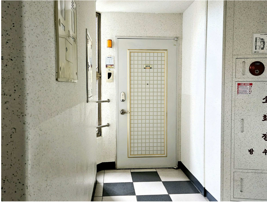
본건 802호 세대현관