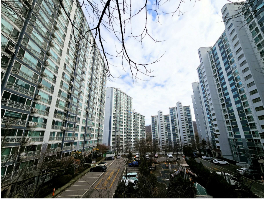
본건 수원동마을쌍용아파트 단지전경