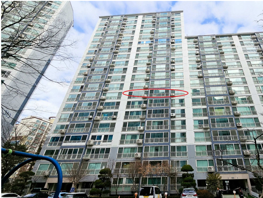
본건 302동 전경