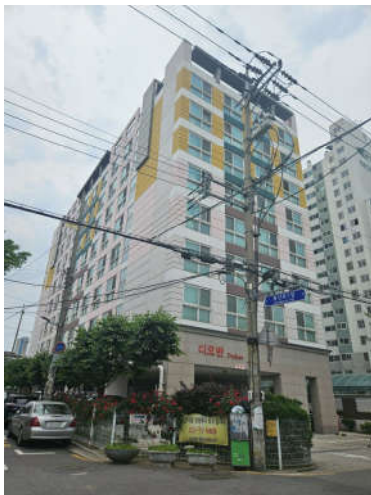
대상물건 소재 건물