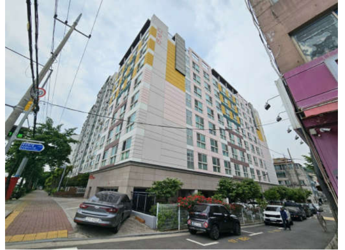
대상물건 소재 건물