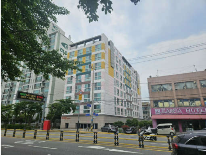
대상물건 소재 건물