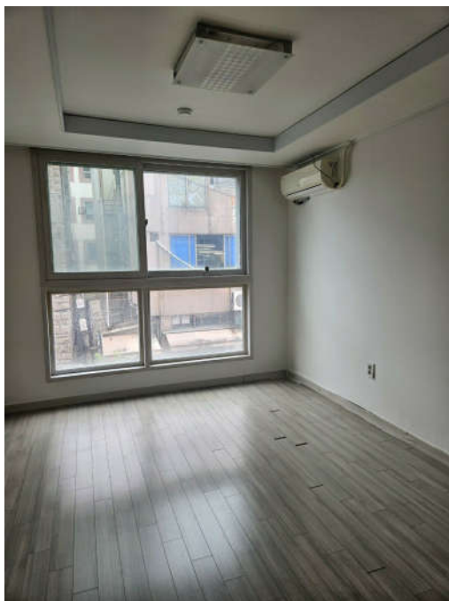
대상물건 내부 전경