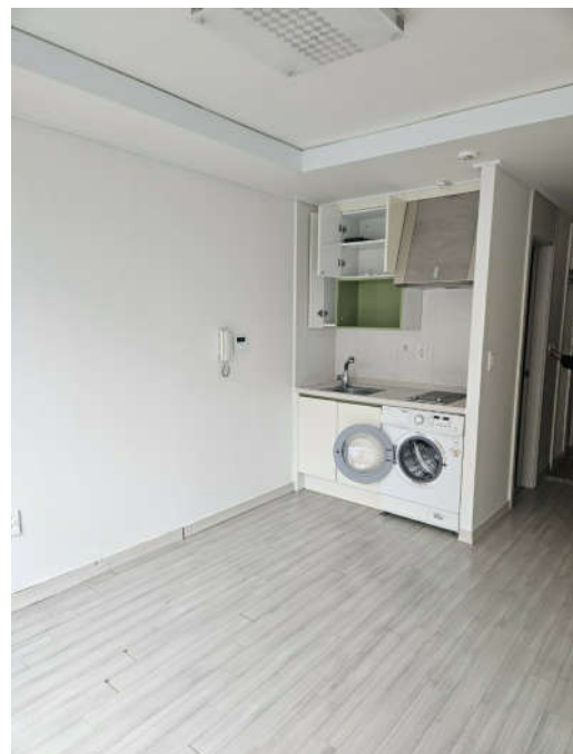
대상물건 내부 전경