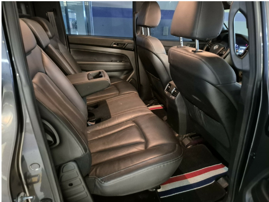
( 2 )