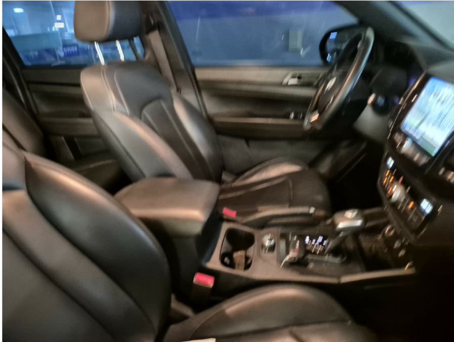
( 1 )