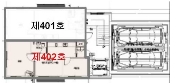
【 호별배치도 】