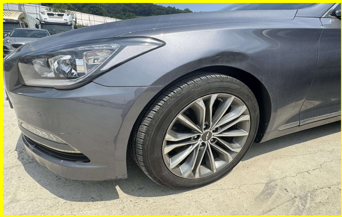
[ 대상물건 좌측전면(흡집부분) ]