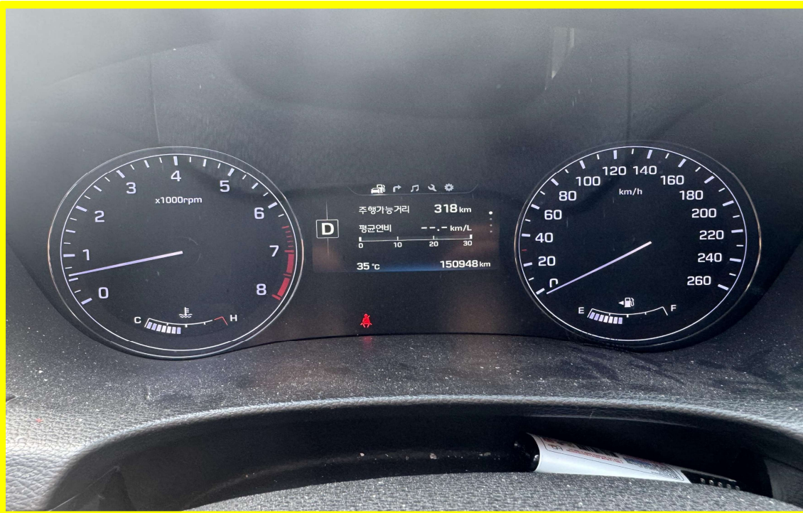
[ 대상물건(계기판) ]