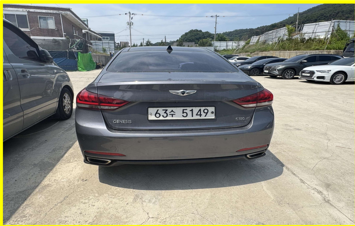
[ 대상물건(후면) ]