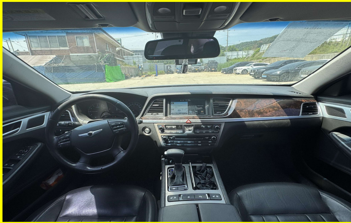
[ 대상물건(센터페시아) ]