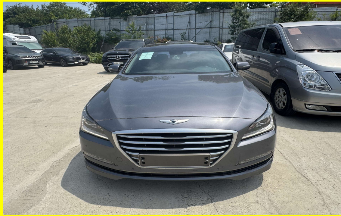
[ 대상물건(전면) ]