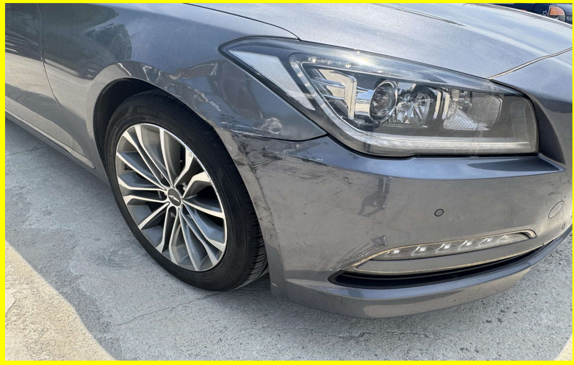
[ 대상물건 우측전면(흡집부분) ]