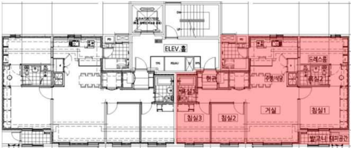
[ 217동 10층 평면도 ]