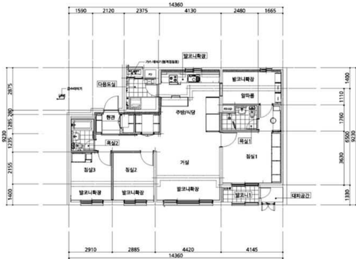
[ 1001호 내부구조도 ]