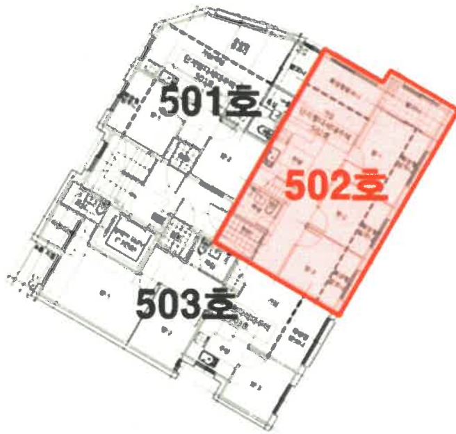
(그린캐슬 제101동 제5층)