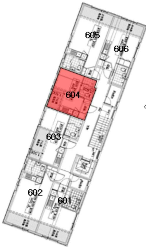
< 호별배치도 >