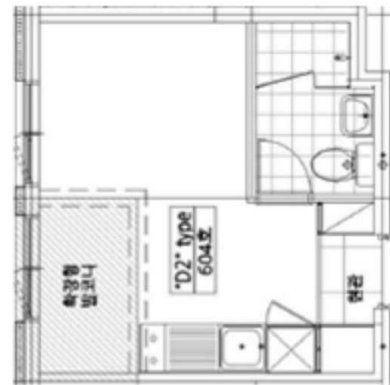
< 내부구조도 >