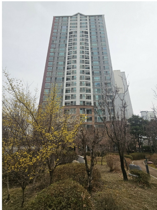
154 ( )