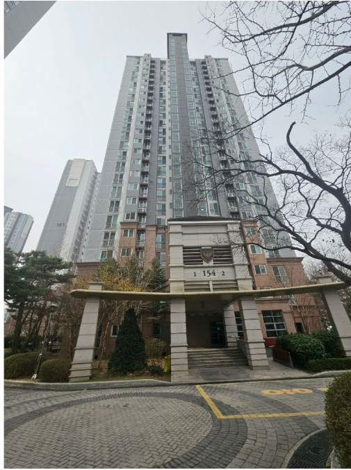
154 ( )