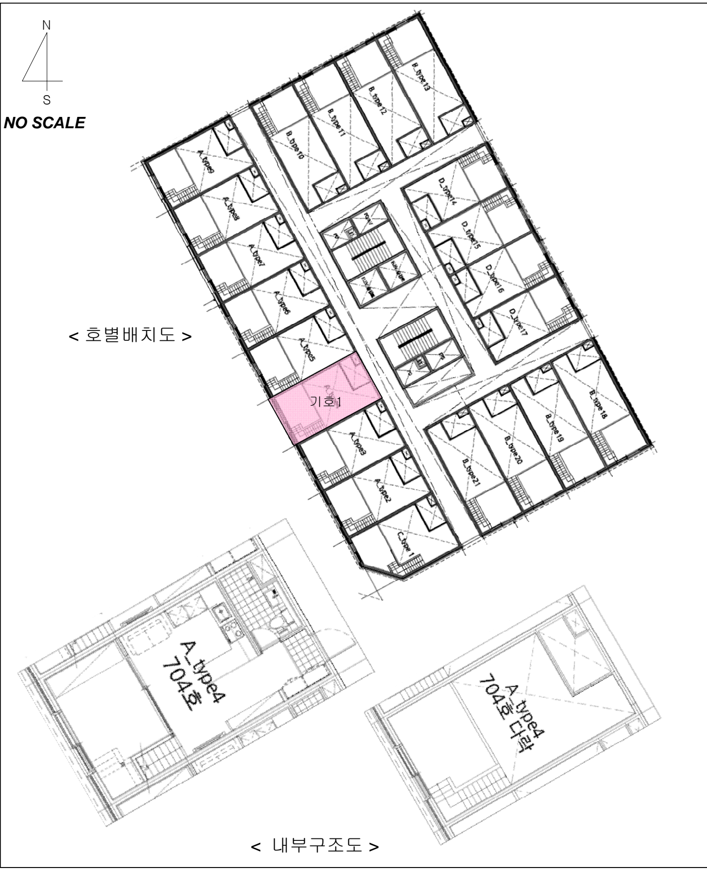
< 호별배치도 >