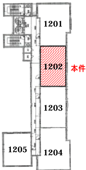
어반파크 제12층 호별배치도