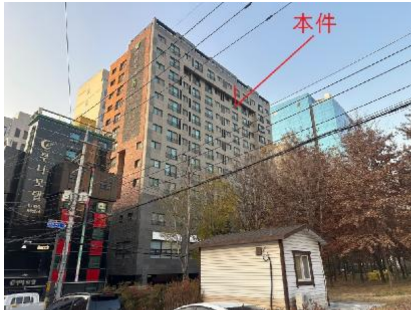
본건 남동측에서 촬영