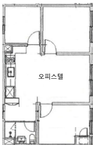
[ 가) 제12층 제1202호 ]