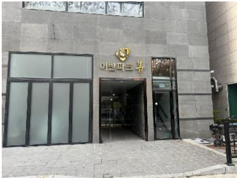
건물 1층 공동출입문 전경