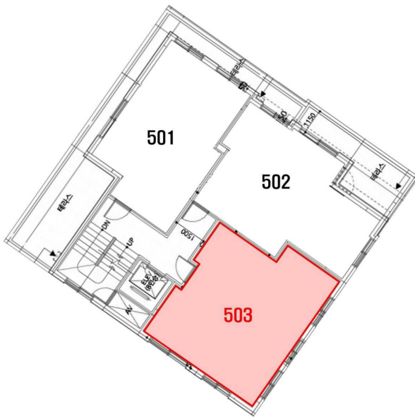
< 호별배치도 >