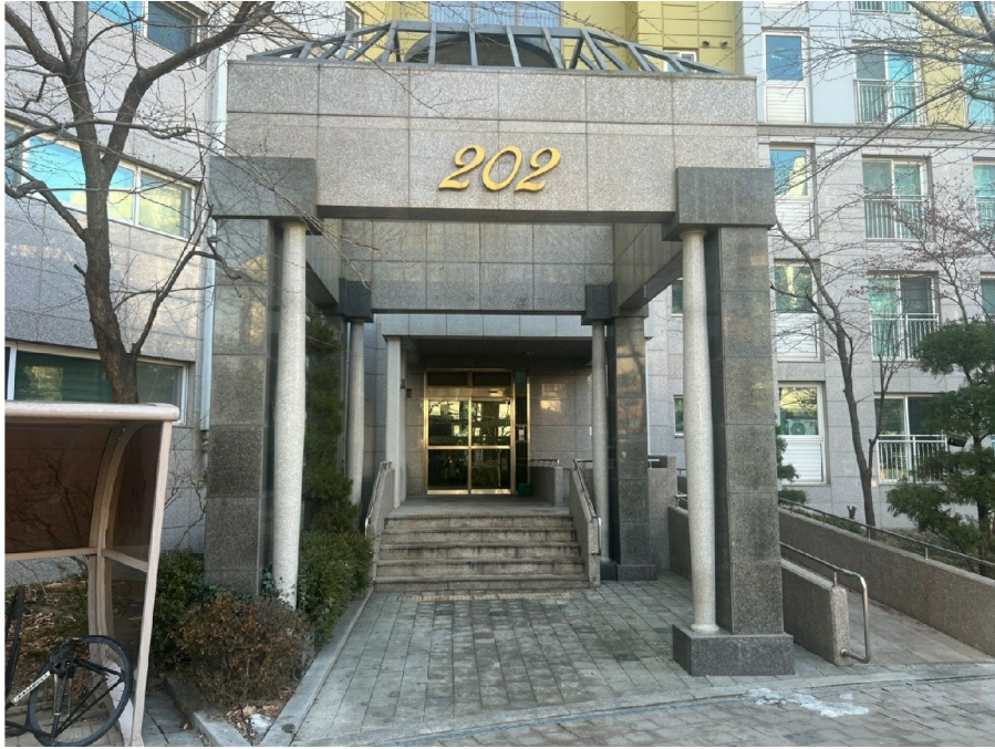
" " 202