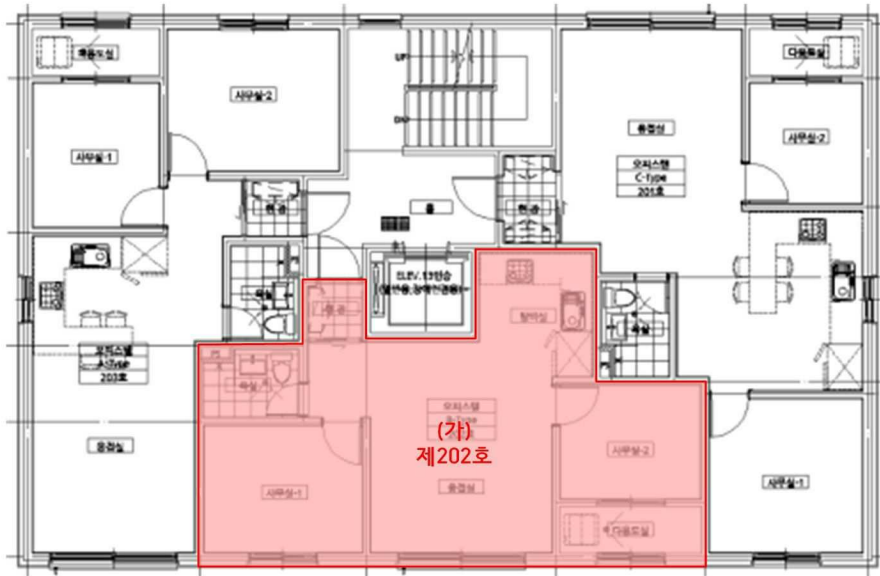
< 제101동 제2층 호별배치도 >