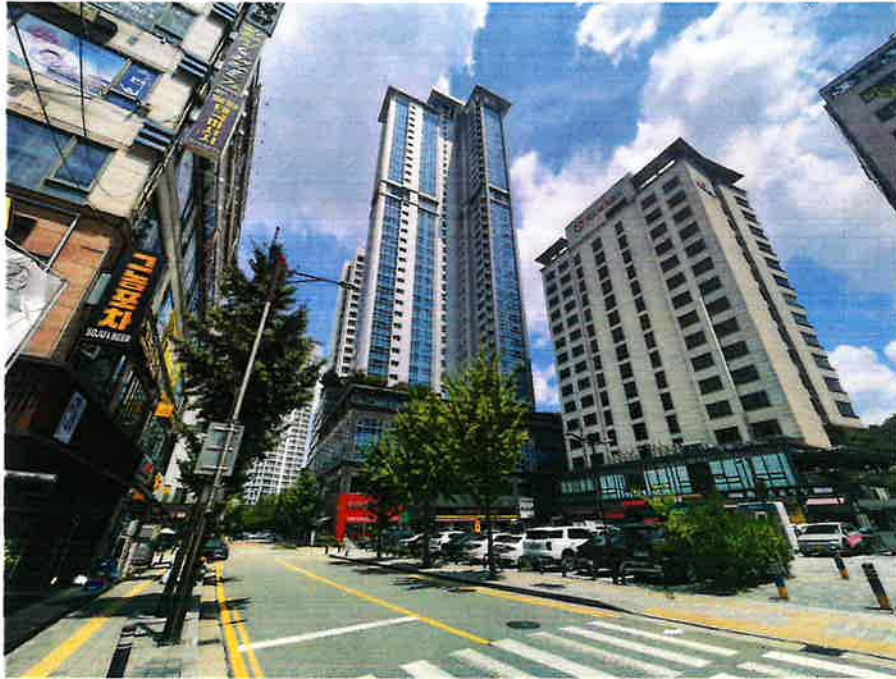
본건 소재 건물 전경