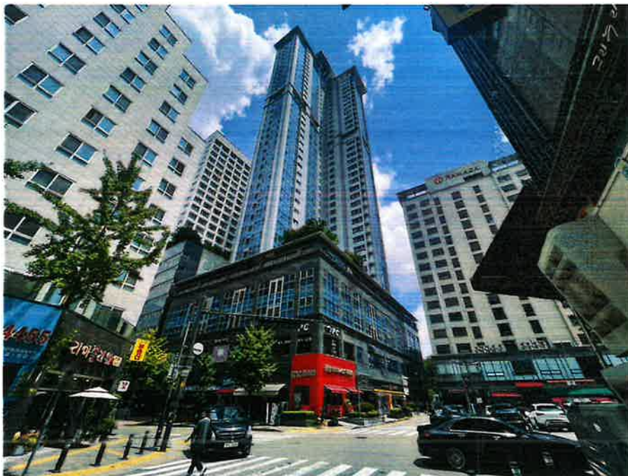
본건 소재 건물 전경