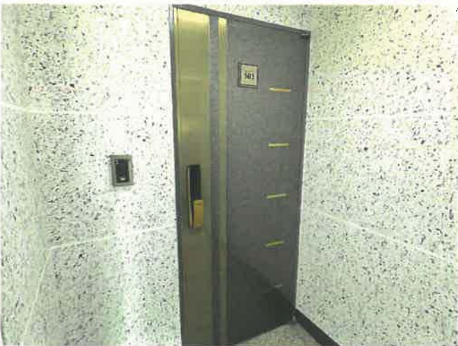
본건 출입문 전경