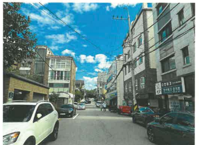
본건 주위 전경