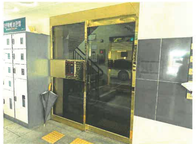
본건 공동현관문 전경