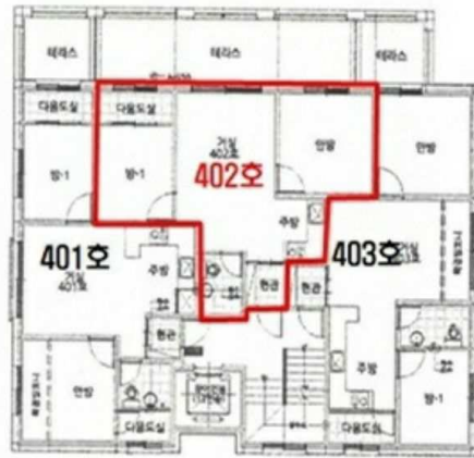
< 호별배치도 >