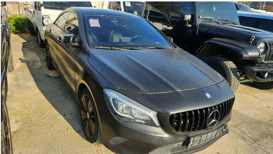
[ 2 ]