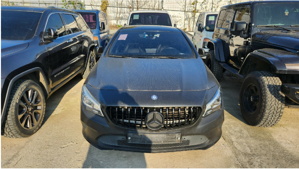
[ 1 ]