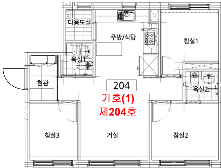
< 제204호 내부구조도 >

※내부구조, 이용상황 등은 건축물대장상 기재내용 및 건축물현황도 등에 의거하였으며, 실제와 다소 상이할 수 있으므로 경매참여시 재확인바람.