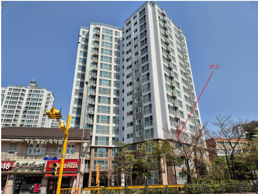
본건 소재동 남서측에서 촬영