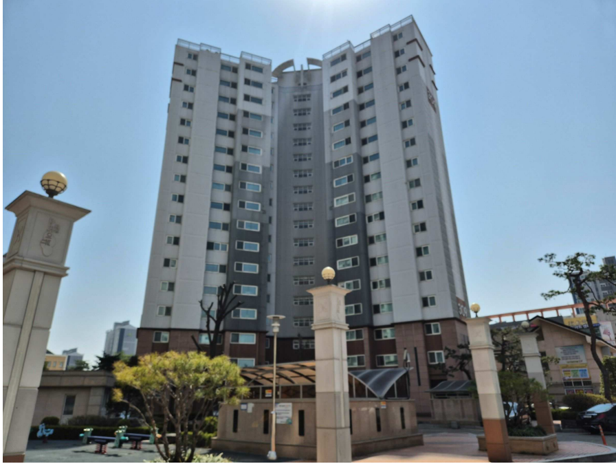
본건 소재동 북서측에서 촬영