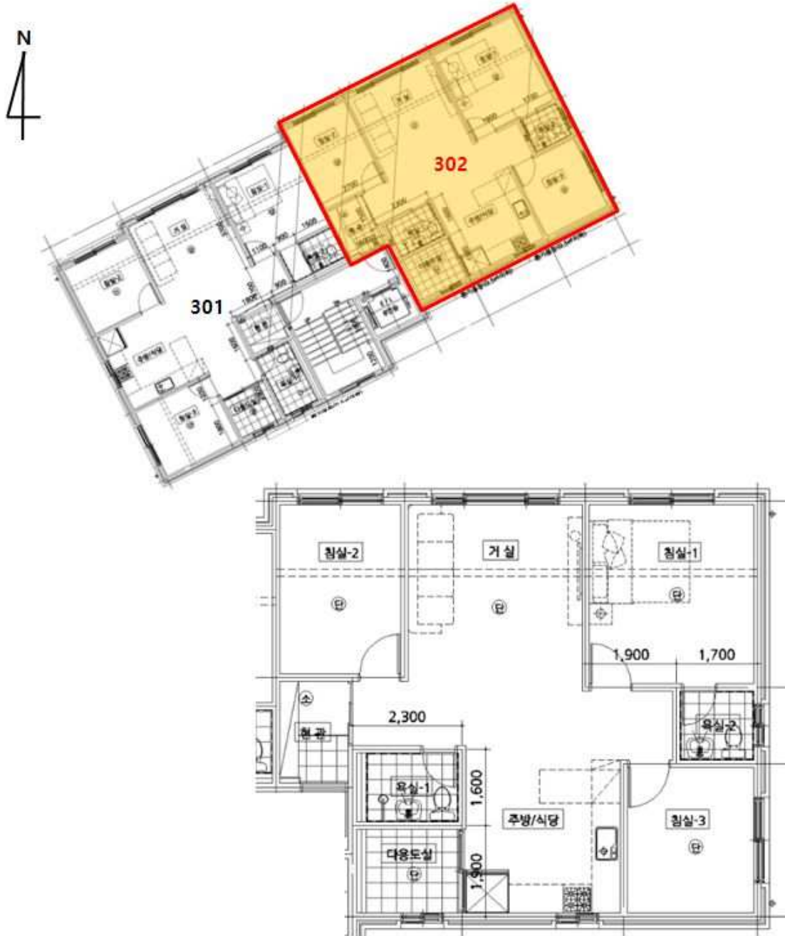
<호별배치도 및 내부구조도>

경기도 용인시 처인구 모현읍 동림리 112-2 다운하우스 씨동 3층 302호