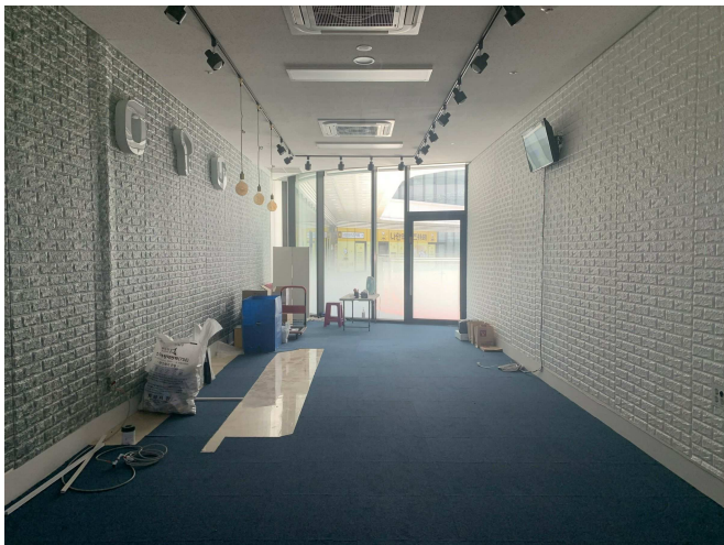
본건 내부 전경