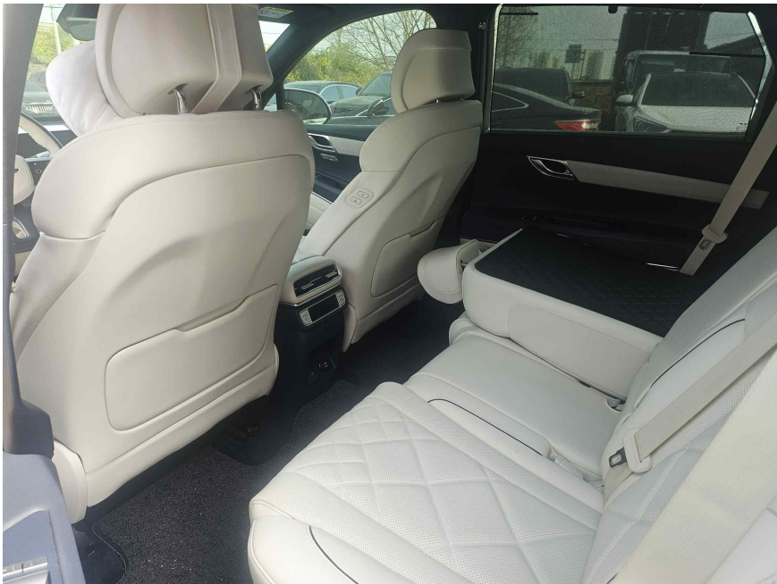
본건 뒷자석 측면