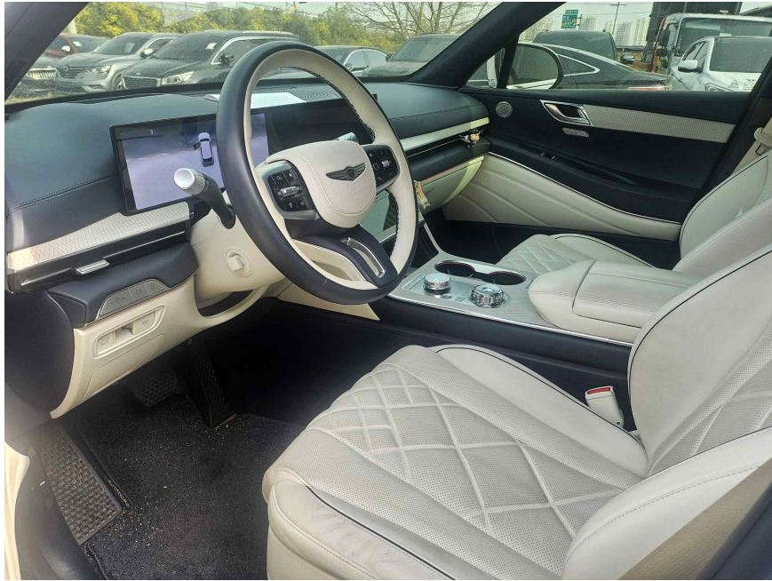
본건 운전석 측면