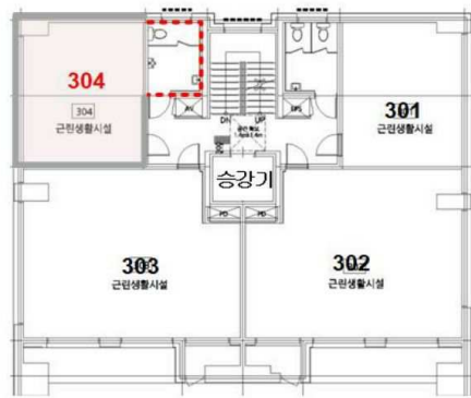
【 호별배치도 】