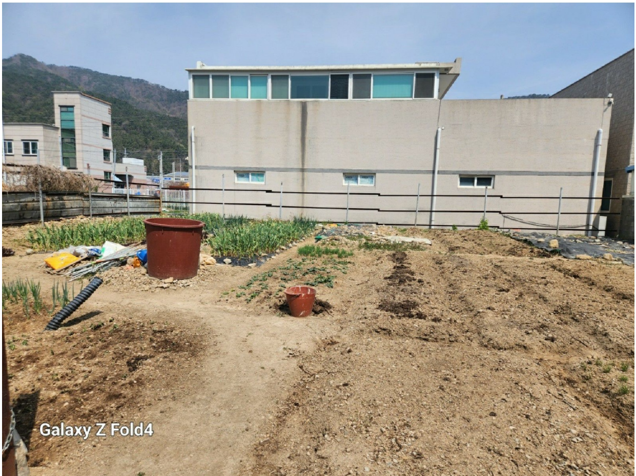
Galaxy Z Fold4