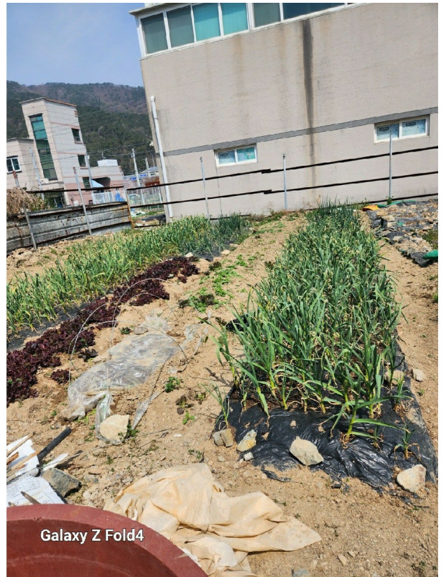
Galaxy Z Fold4