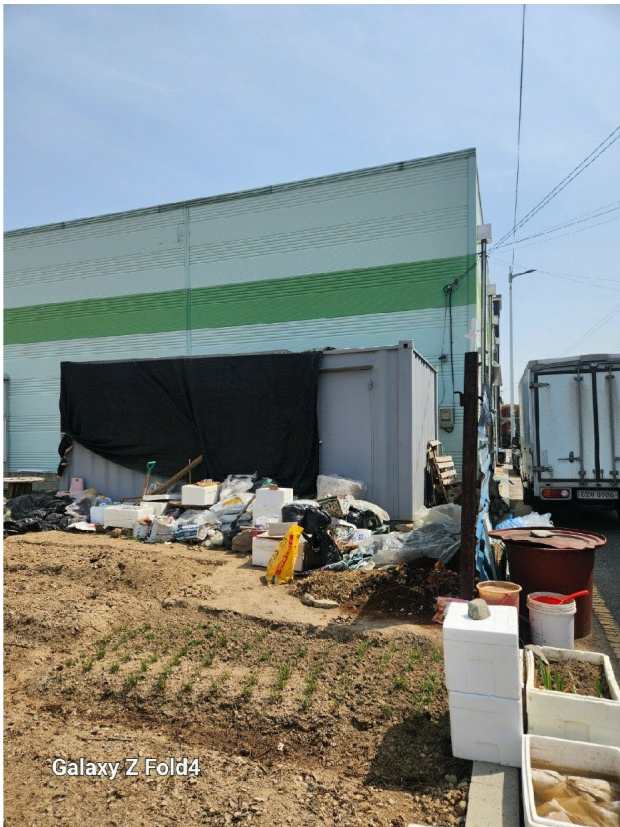
Galaxy Z Fold4