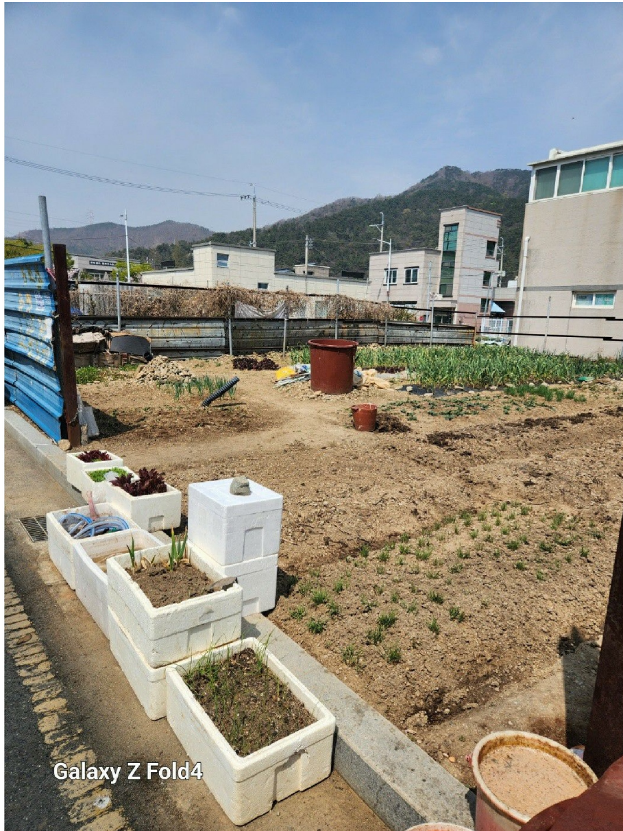
Galaxy Z Fold4