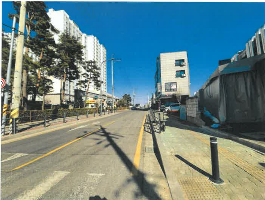
[ 주변 환경 ]