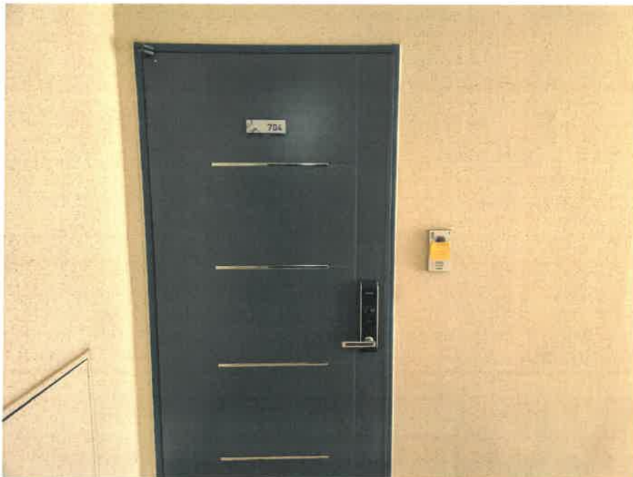
[ 본 건 현 관 ]