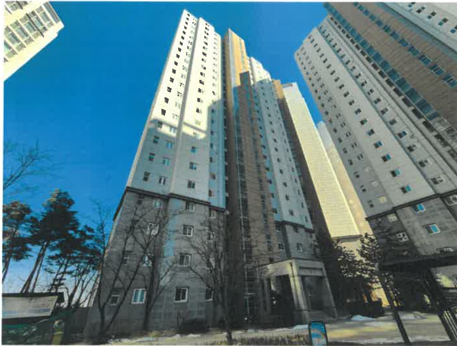
[ 본 건 전 경 ]