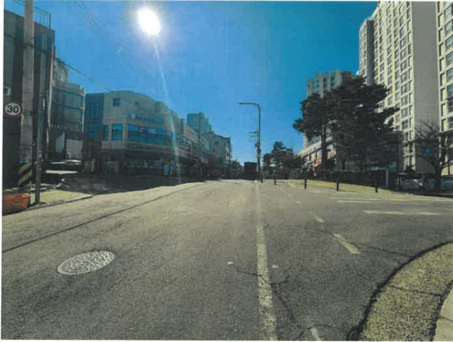
[ 주변 환경 ]