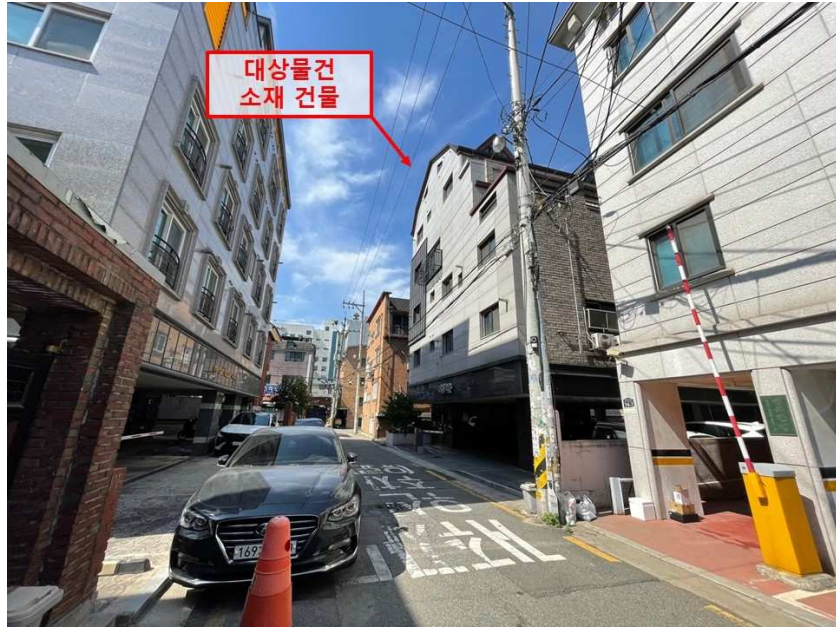
[ 대상물건 소재 건물 전경 (북동측 촬영) ]