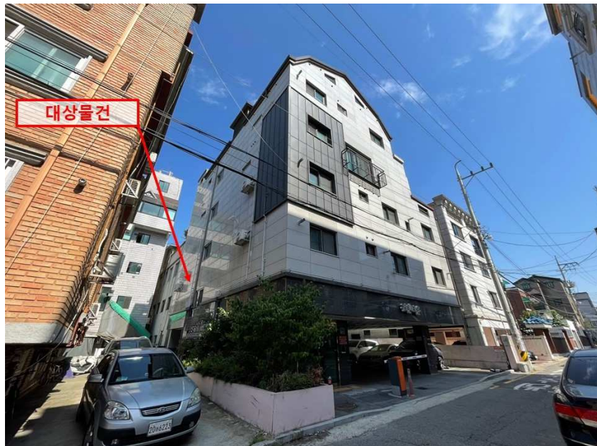
[ 대상물건 전경 (남동측 촬영) ]