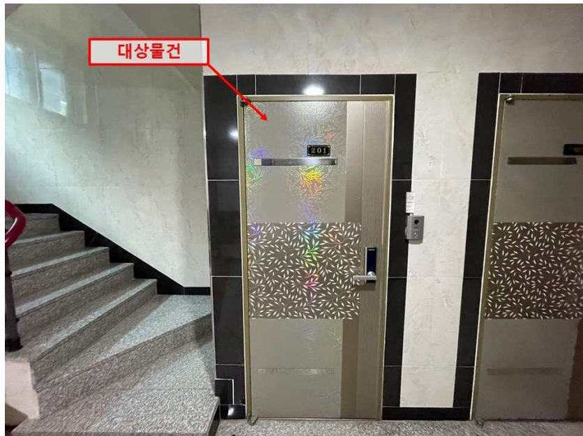
[ 대상물건 현관문 전경 ]