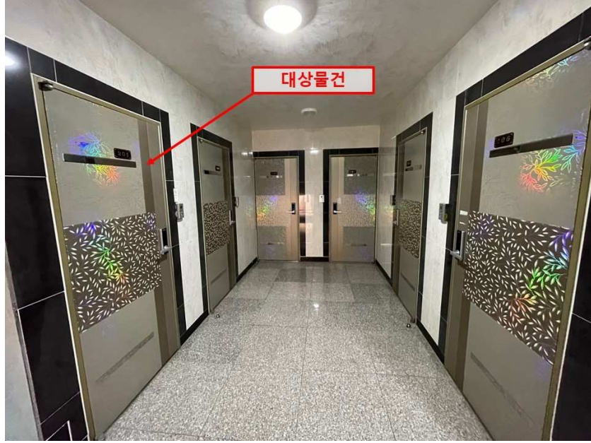
[ 대상물건 현관문 전경 ]