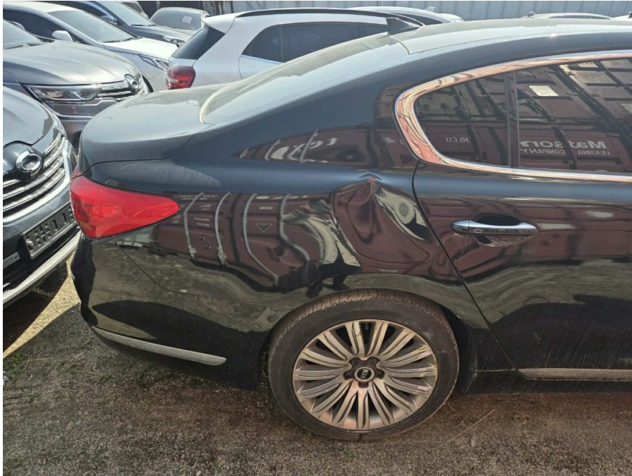
본건 우측 후면(찌그러진 부분)