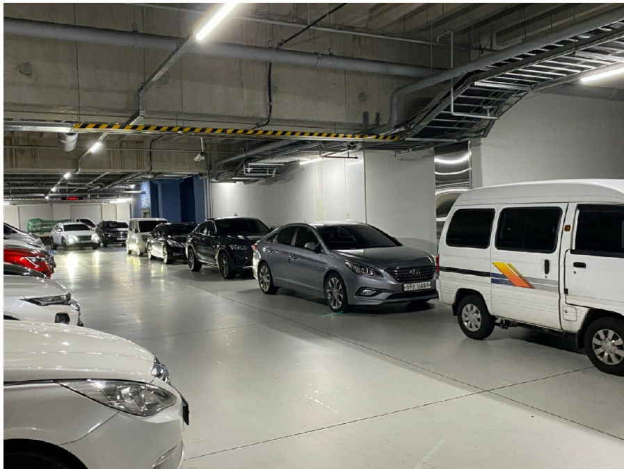
( 017 )