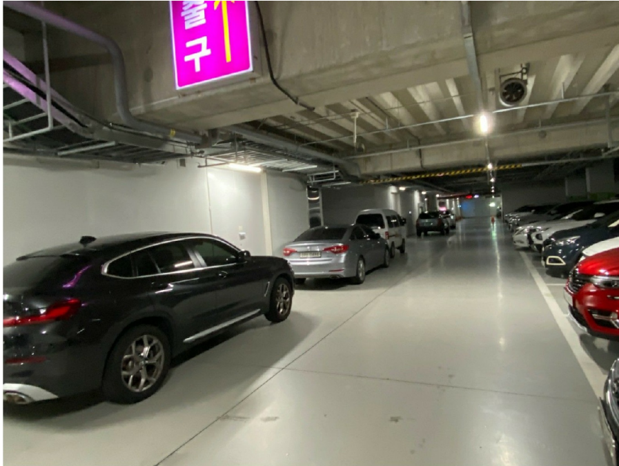
( 017 )