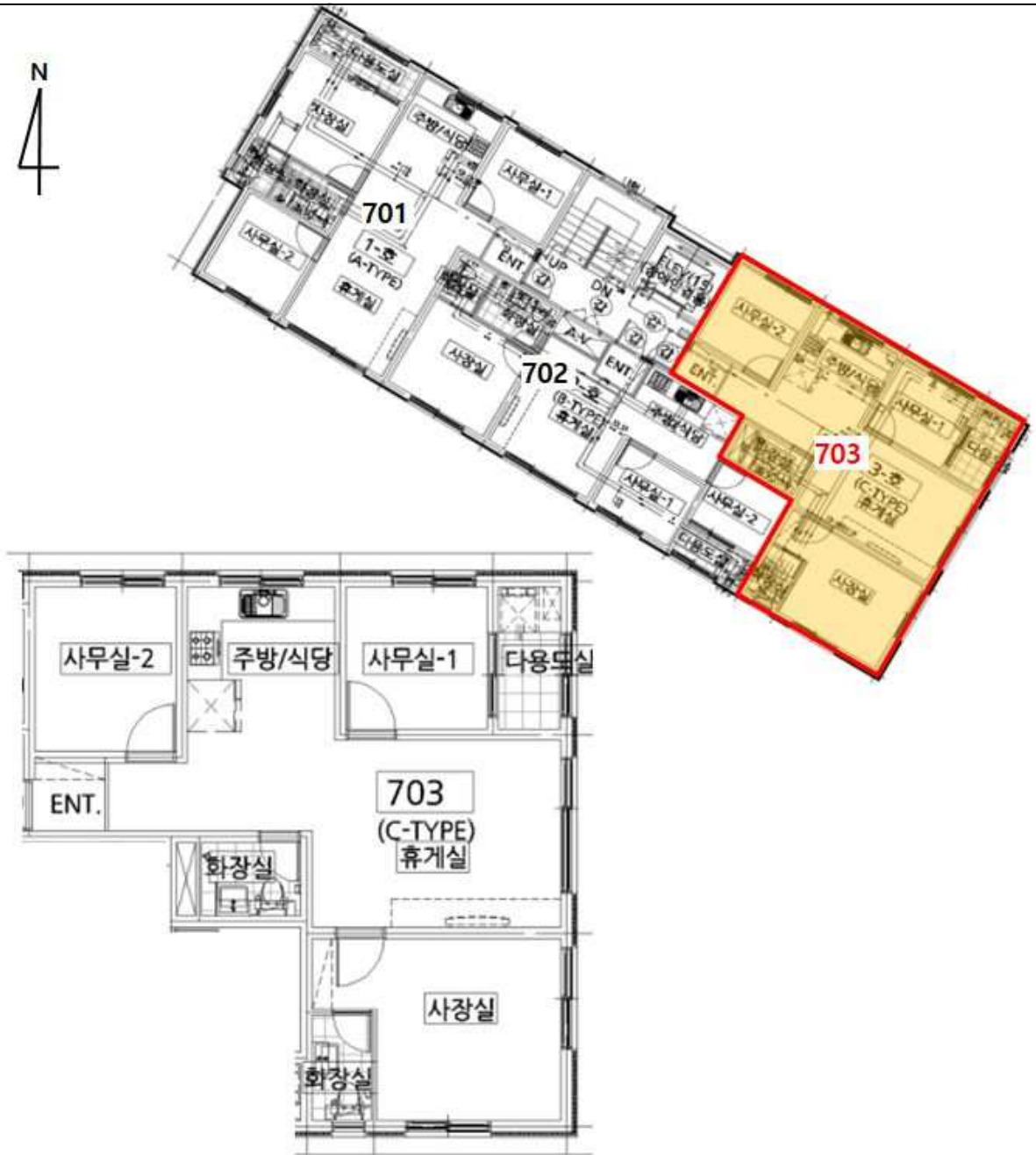
<호별배치도 및 내부구조도>

경기도 용인시 기흥구 마북동 314-1 가온누리빌리지 에이동 7층 703호