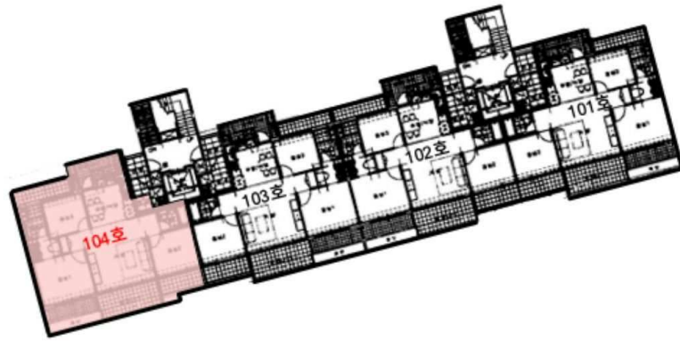
본건 : 오목천동 푸르지오 1단지 제105동 제1층 제104호