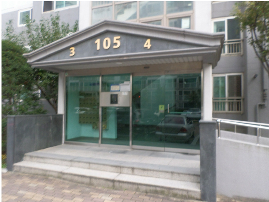
105 3, 4