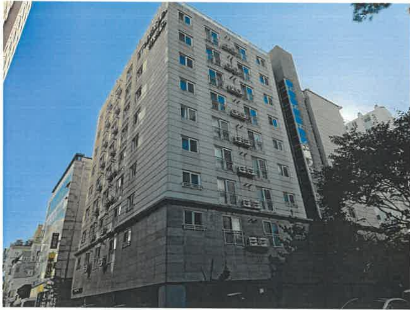
[ 대상물건 전경 ]