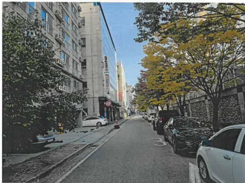
[ 주위 전경 ]