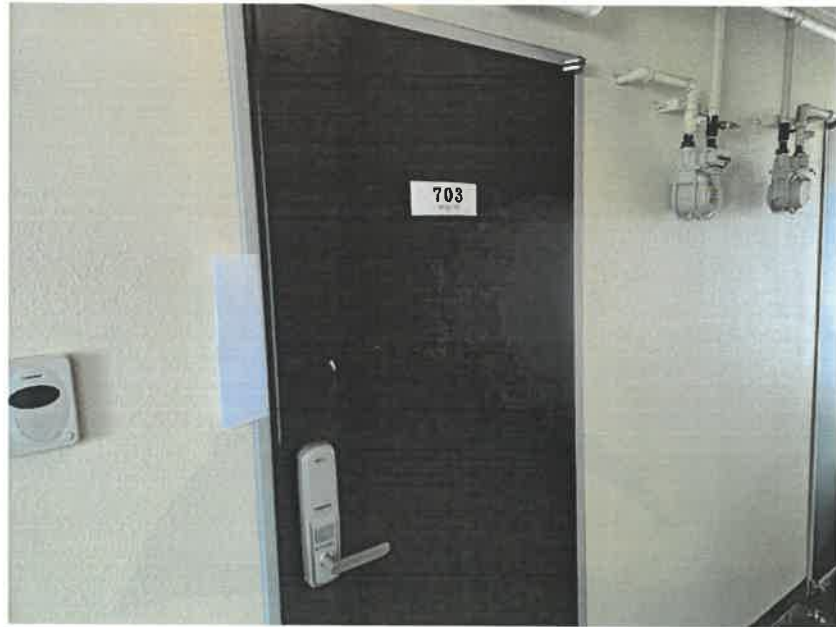
[ 대상물건 표식 ]