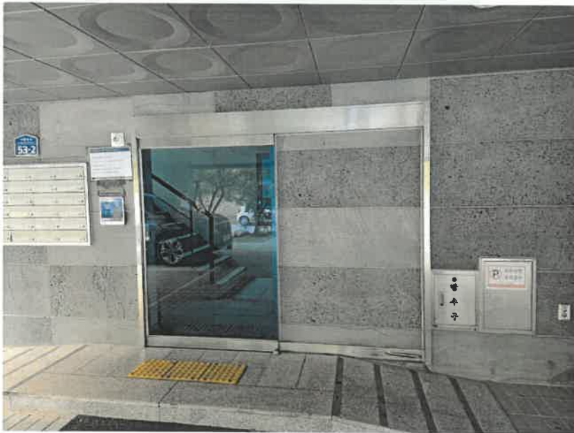
[ 대상물건 주출입구 ]