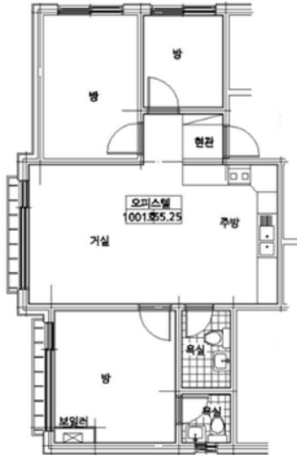
< 월드타워팰리스 제10층 제1001호 >