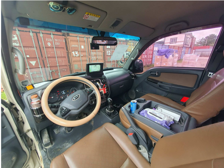
차량 내부 전경