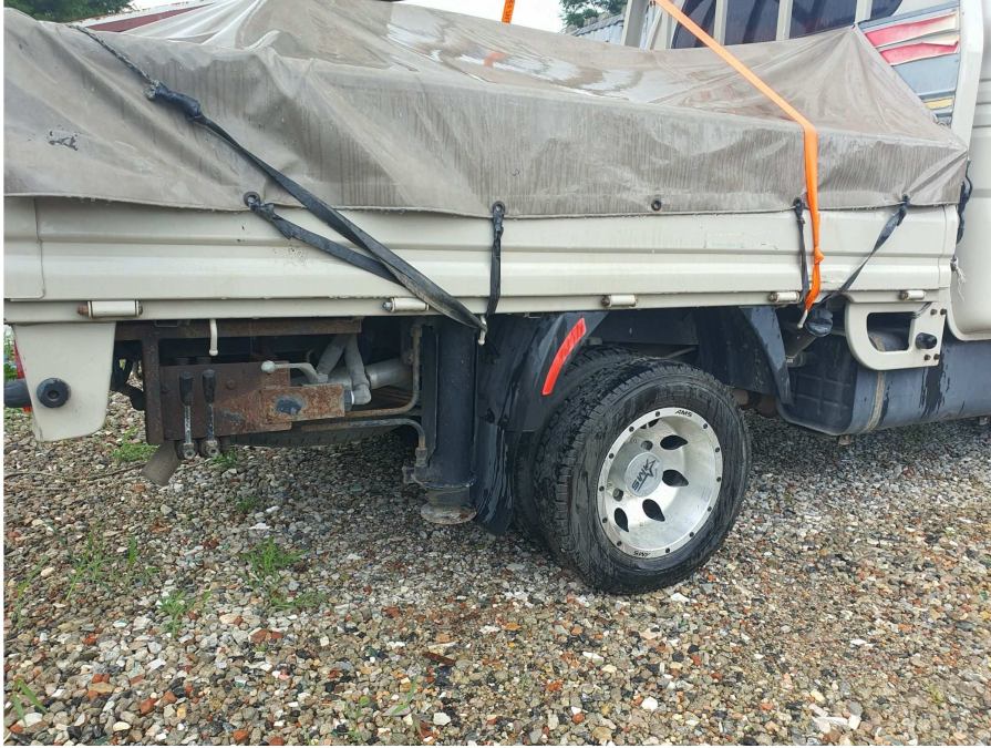
차량 하부 상태