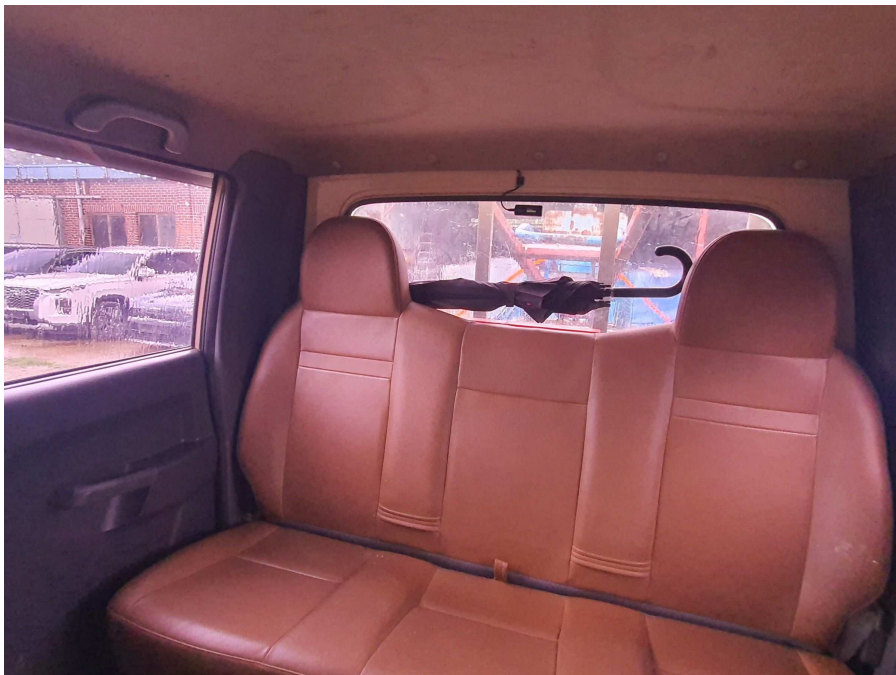
차량 내부 전경