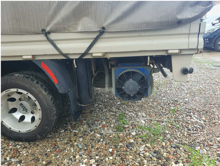
차량 하부 상태