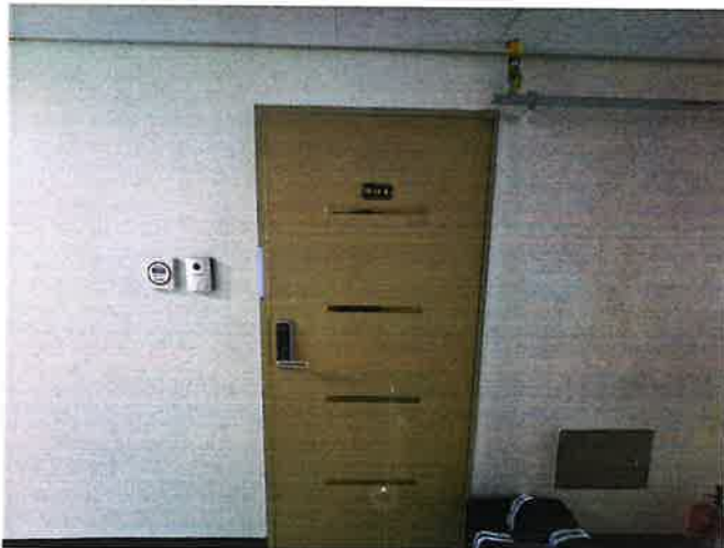
본건 현관 전경