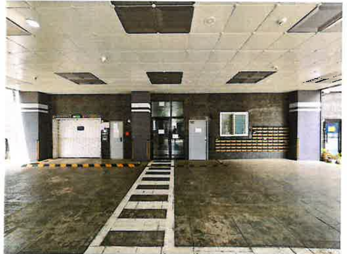
본건 공동현관 출입구 전경