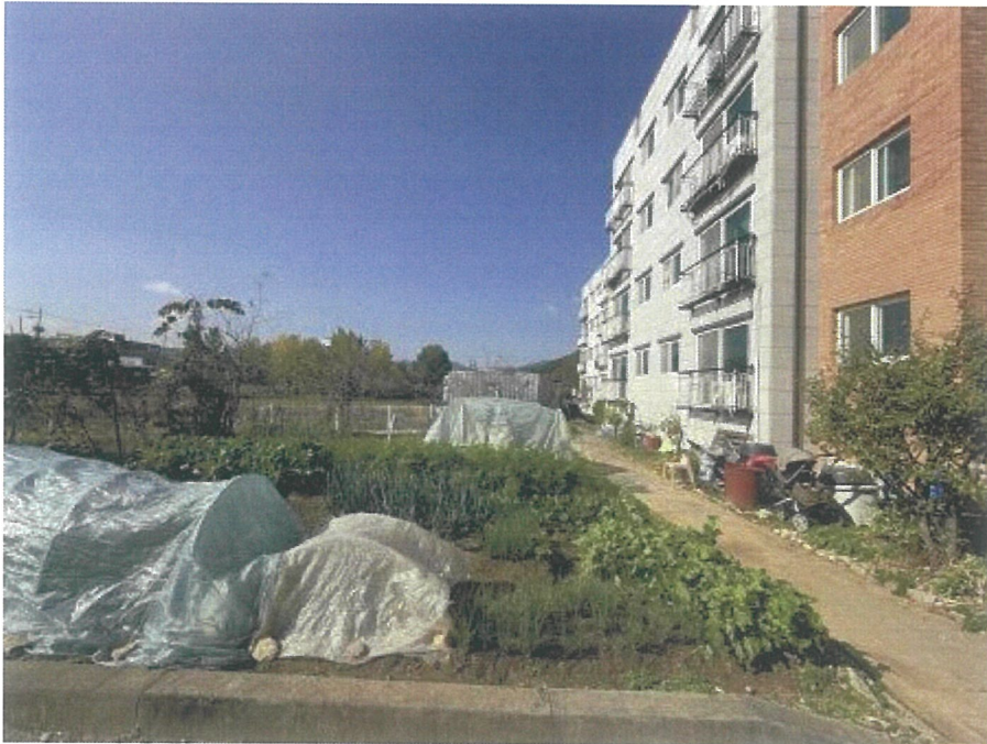
【 본건 주위환경 】