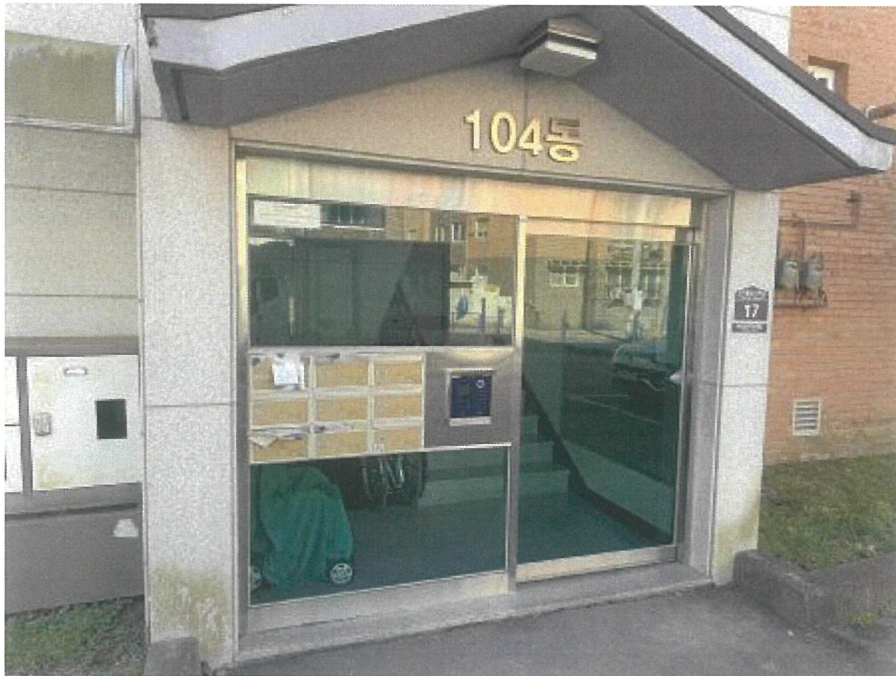
【 공동출입구 】