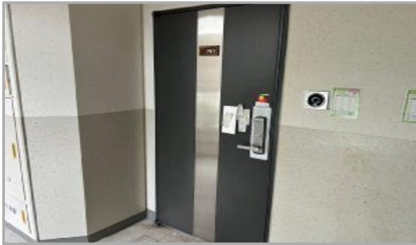
본건 호 전경