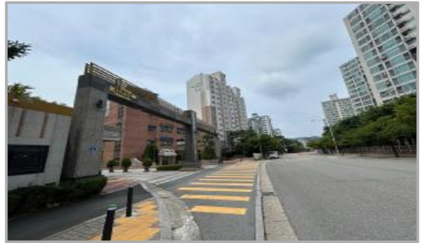
본건 주위 전경