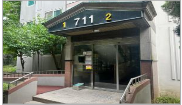
본건 출입구 전경