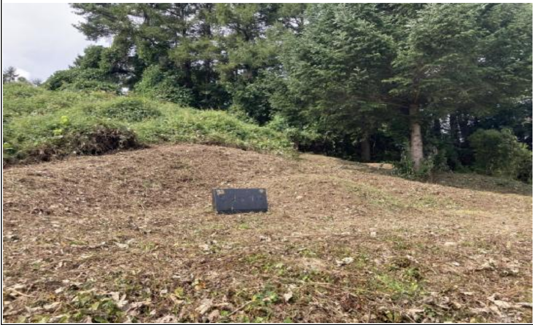
본건 지상 소재하는 분묘