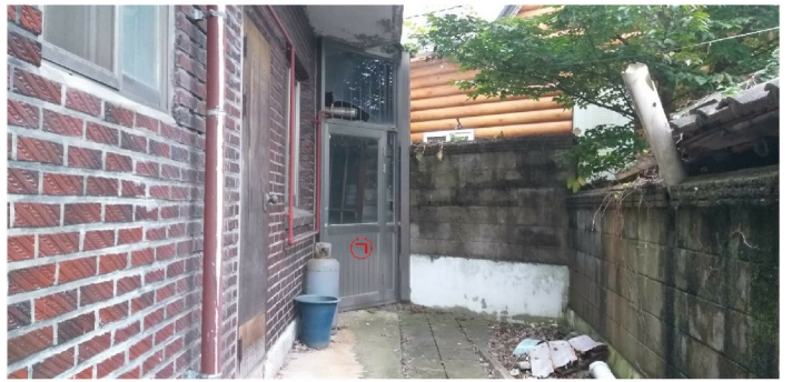
( 1 )