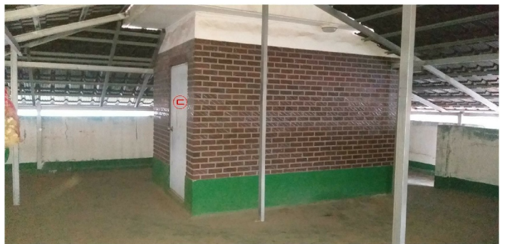
( 2 )