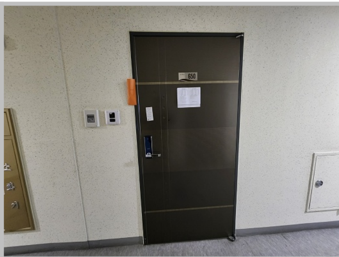
【 현관문 전경 】