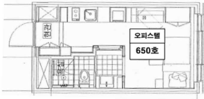
(우성르보아파크 제6층 650호)