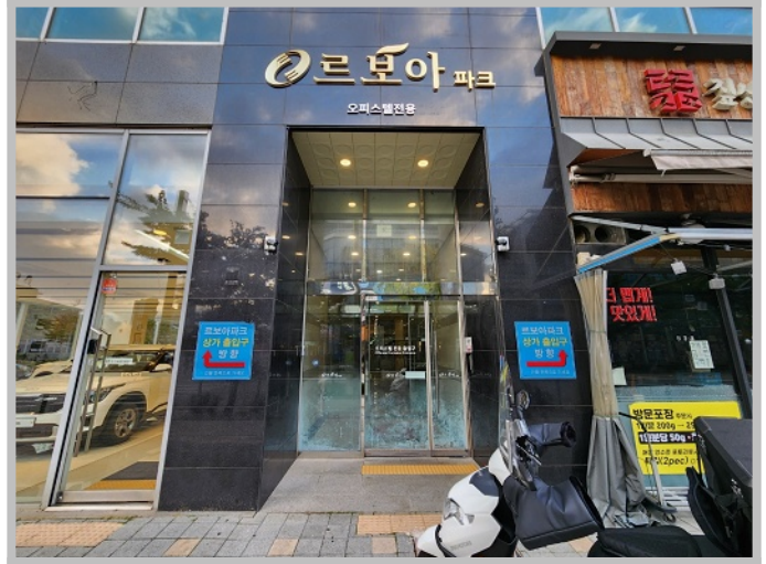
【 공동 출입구 전경 】