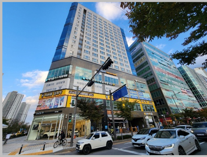
【 본건 건물 전경 】