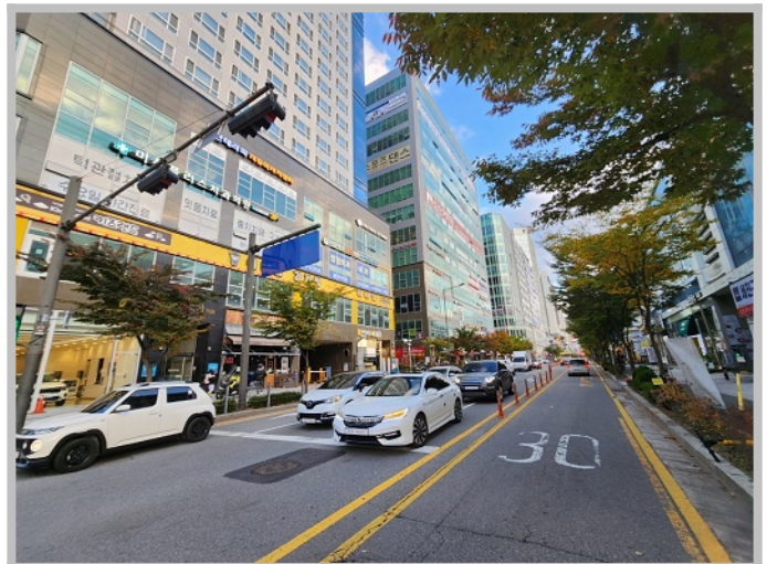
【 주위환경 】