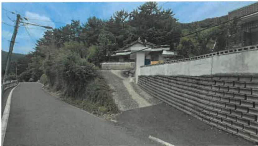
기호(1) 일부 진입로, 축대, 담장 및 대문 등 전경