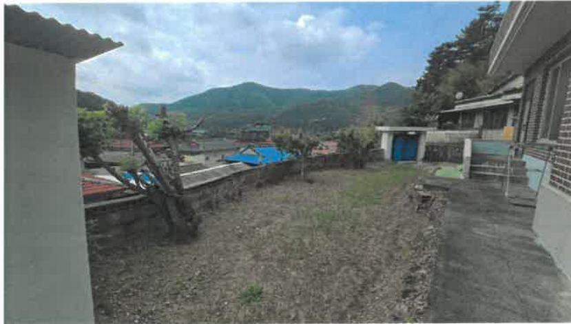
기호(1) 일부 전경