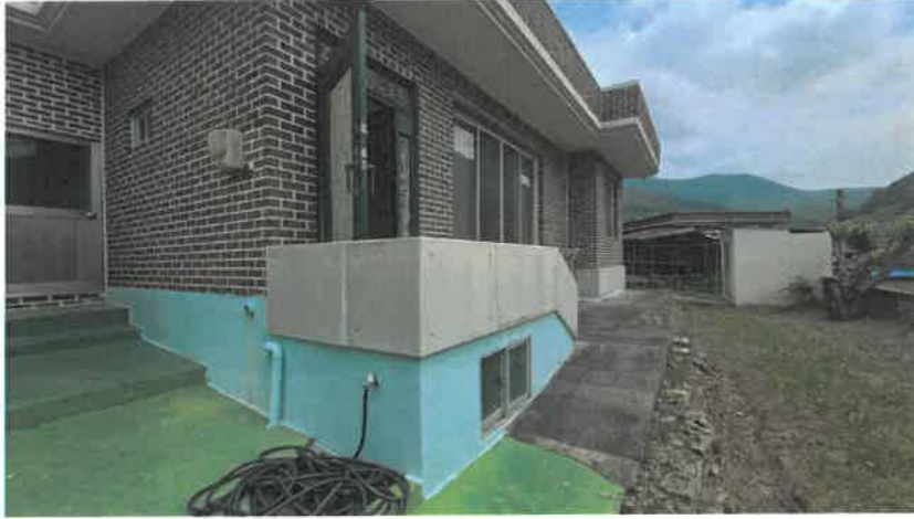
기호(2) 주변 데크(하단부 창고 등), 계단 등 전경