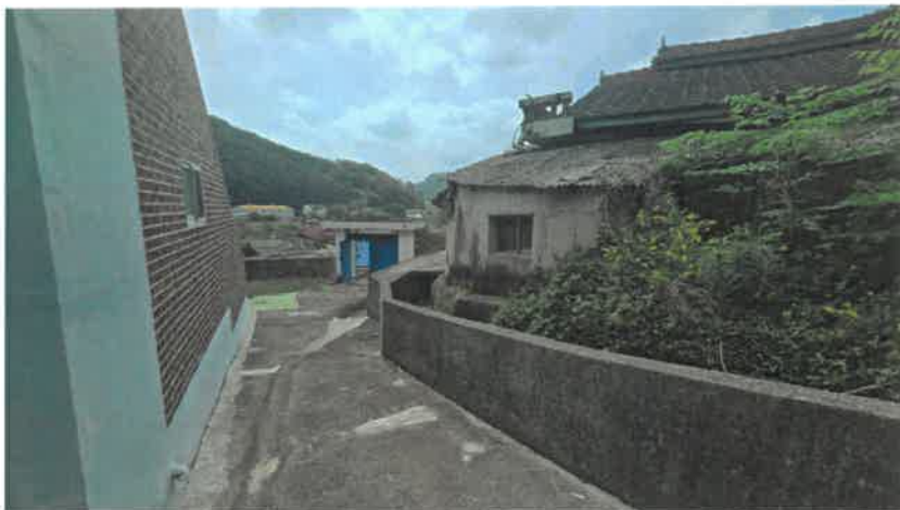
기호(1) 일부 `타인점유`부분 및 `현황`구거`부분 전경