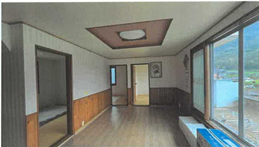
기호(2) 내부 전경