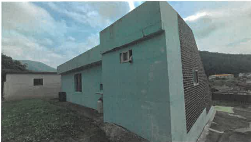
기호(2) 일부 전경