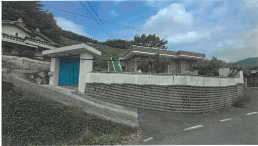
본건(1,2) 및 주위 전경