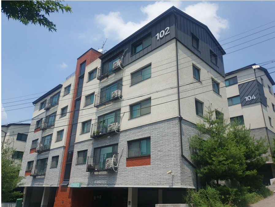
본건 소재 건물