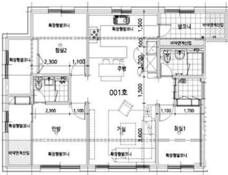
<호별배치도 및 내부구조도>