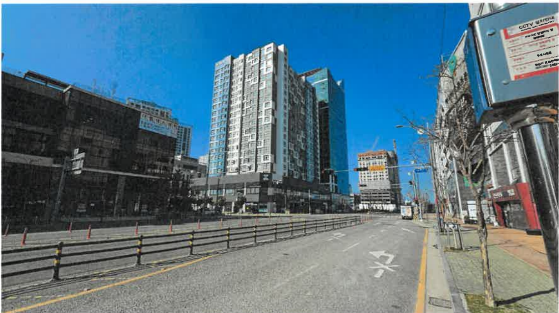
본건 및 주변전경