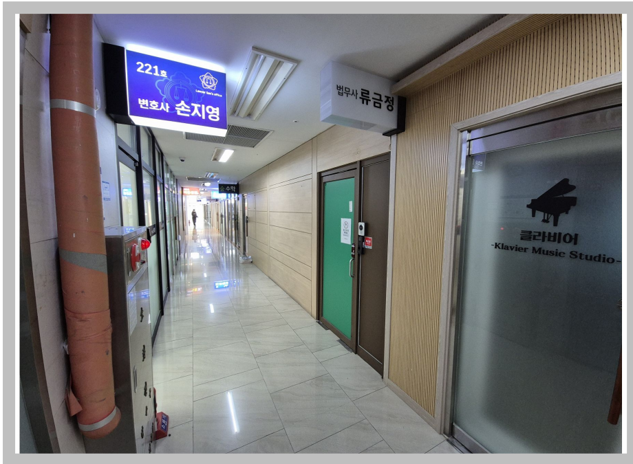
【 (가) 】