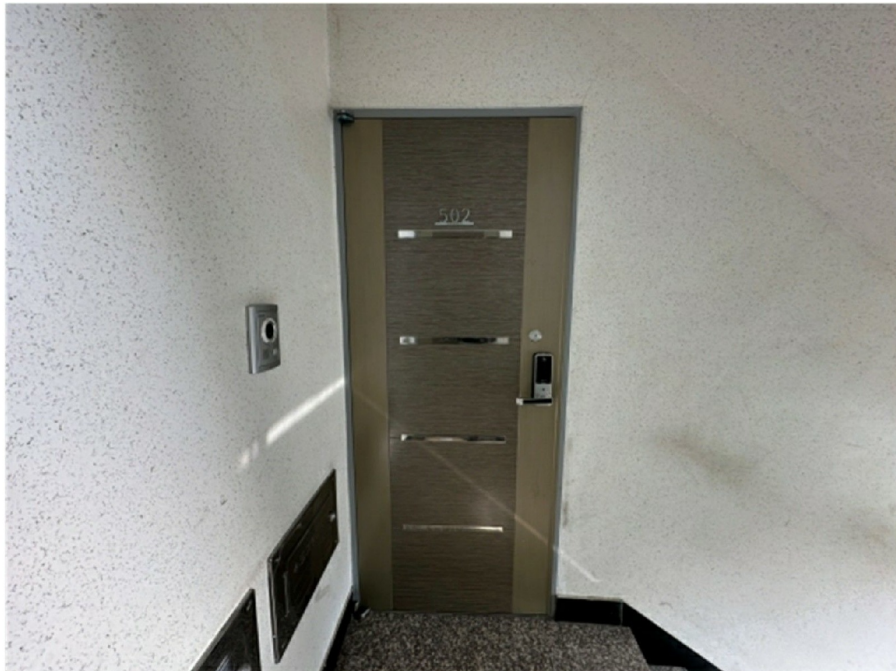
( 502 )